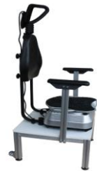
Plate komplett mit Sitzgestell* oder komplett mit Bettgestell*

Fernsteuerung Frequenz: 13Hz / 30 Hz Max. Belastbarkeit: 130 kg LxBxH: 50x42x120 cm / 14 kg