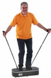
ZHENDONG – C&S VARIO