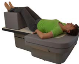
ZHENDONG – RELAX

Technische Daten: Frequenz: 7,8 - 30 Hz stufenlos B/H/T 685x345x160mm Vibrationsfläche ca. 660 x 330mm 120 Watt, 12 Volt DC Eigengewicht: 16 kg max. Belastbarkeit: 130 kg ZHENDONG – C&S VARIO medical